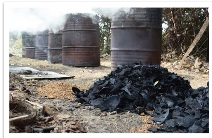
Gambar 3. Hasil dari arang kelapa