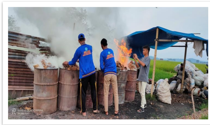
Gambar 2. Proses pembuatan batok kelapa