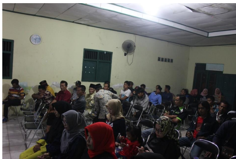
Gambar 2. Peserta Sosialisasi Pemanfatan Website Desa Gumukmas