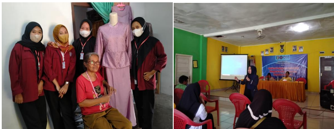
Gambar 1. Kegiatan survey dan Sosialisasi Kepada Pelaku UMKM

Sebelum melaksanakan sosialisasi mengenai manfaat dan pentingnya legalitas usaha berupa NIB, tim pengabdian melakukan survey dengan mendatangi rumah para pelaku UMKM satu persatu supaya efektif dan efisien untuk mencari informasi yang akurat dengan mengajukan beberapa pertanyaan. Sosialisasi secara door to door merupakan cara yang efektif karena pelaku bisa mendapatkan informasi yang jelas dari tim pengabdian secara langsung dan tim pengabdian juga mengadakan sosialisasi di balai pekon. Dalam kegiatan ini kami banyak menjelaskan tentang Nomer Induk Berusaha (NIB) yang nantinya akan digunakan sebagai legalitas usaha. Bagi pelaku UMKM yang ingin mendaftar bisa mengajukan persyaratan-persyaratan yang kami butuhkan untuk membuat NIB seperti KTP, KK, NPWP, e-mail aktif, Nomer WA dan lain-lain. Berikut gambar saat tim KKN melakukan survey dan sosialisasi.