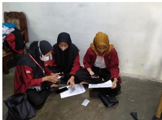
Gambar 2. Proses Pembuatan NIB UMKM