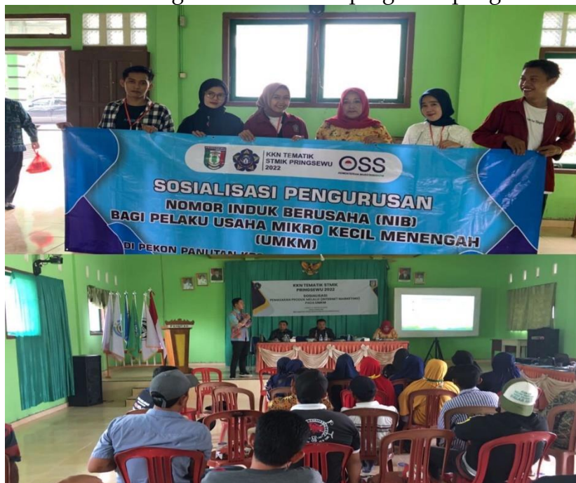
Gambar 2. Sosialisasi dan Pendampingan Pengisian Formulir Pembuatan NIB

Tahap kedua yaitu melakukan sosialisasi dan pendampingan pembuatan NIB para pelaku UMKM. Kegiatan ini dilaksanakan dengan cara door to door. Cara tersebut dipilih berdasarkan arahan dari kelurahan dan agar nantinya kegiatan sosialisasi dan pendampingan pembuatan NIB ini dapat dilaksanakan dengan efektif dan efisien. Sosialisasi dengan cara door to door juga dirasa lebih efektif dalam memberikan edukasi kepada para pelaku UMKM tanpa adanya suatu perkumpulan di suatu tempat. Dalam kegiatan ini, kami mensosialisasikan kepada pelaku UMKM penjelasan mengenai Nomor Induk Berusaha (NIB), urgensi pembuatan NIB bagi UMKM dan manfaat kepemilikan NIB bagi pelaku UMKM. Setelah sosialisai dlakukan, kami menawarkan untuk membantu proses pembuatan NIB tersebut dengan cara mendampingi saat pengisian formulir.