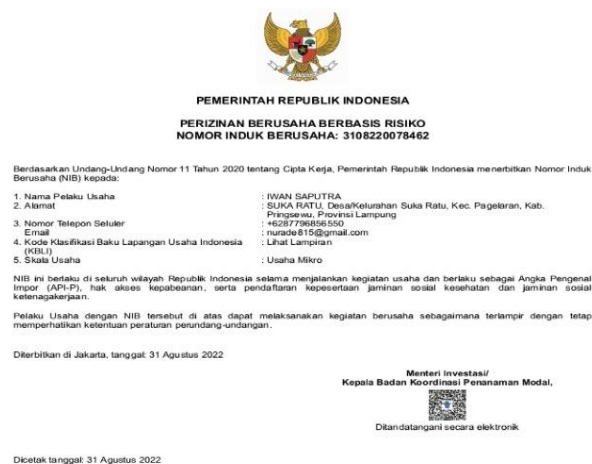
Gambar 5. Salah Satu Bentuk NIB Pelaku UMKM Kelurahan Sukaratu