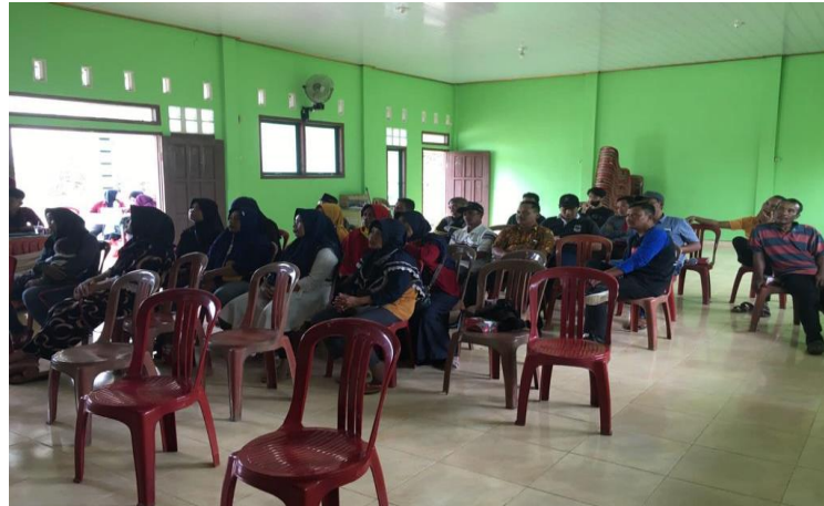
Gambar 1. Pendataan pelaku UMKM yang belum memiliki NIB di Kelurahan Sukaratu

kami membuat brosur sebagai bentuk sosialisasi akan pentingnya kepemilikan NIB oleh pelaku UMKM