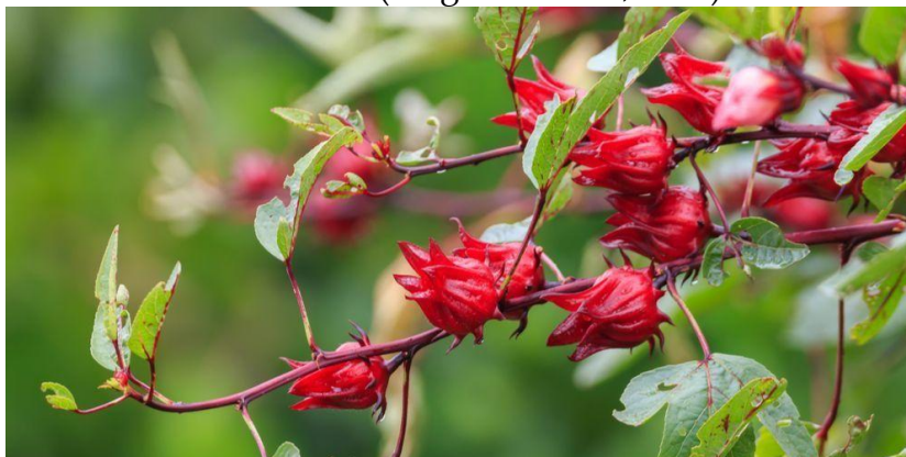
Gambar 1. Bunga rosella

Rosella ( Hibiscus sadbariffa L.) merupakan anggota famili Malvaceae. Rosella dapat tumbuh baik di daerah beriklim tropis dan subtropis. Tanaman ini mempunyai habitat asli di daerah yang terbentang dari India hingga Malaysia. Sekarang, tanaman ini tersebar luas di daerah tropis dan subtropis di seluruh dunia dan mempunyai nama umum yang berbeda-beda di berbagai negara. Tanaman rosella hidup berupa semak yang berdiri tegak dengan tinggi 0,5-5 meter, memiliki batang yang berbentuk silindris dan berkayu, serta memiliki banyak percabangan. Ketika masih muda, batangnya berwarna hijau. Dan ketika beranjak dewasa dan sudah berbunga, batang rosella berwarna cokelat kemerahan. Pada batang rosella melekat daun-daun yang tersusun, berwarna hijau, berbentuk bulat telur dengan pertulangan menjari dan tepi beringgit. Ujung daun rosella ada yang meruncing dan tulang daunnya berwarna merah. Panjang daun rosella dapat mencapai 6-15 cm dan lebar 5-8 cm. Akar yang menopang batangnya berupa akar tunggang. Mahkota bunganya berbentuk corong yang tersusun dari 5 helai daun mahkota (Maghfirahmah, 2019).