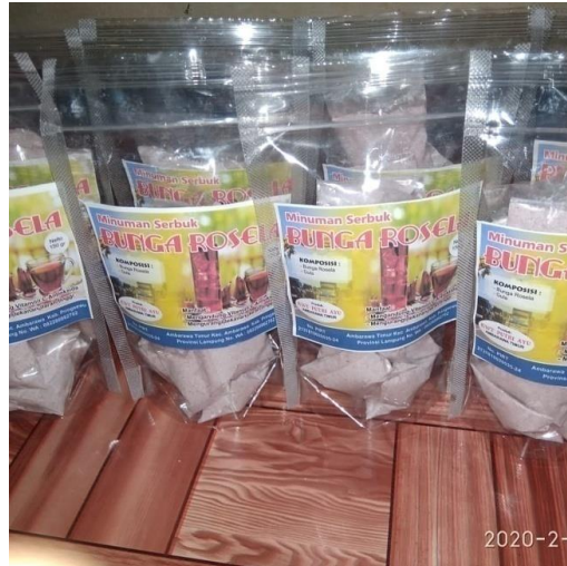
Gambar 3. Kemasan teh bunga rosela sudah menjadi serbuk