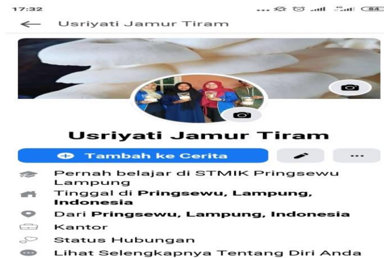
Gambar 5. Registrasi facebook dan hasil produk yang sudah di input