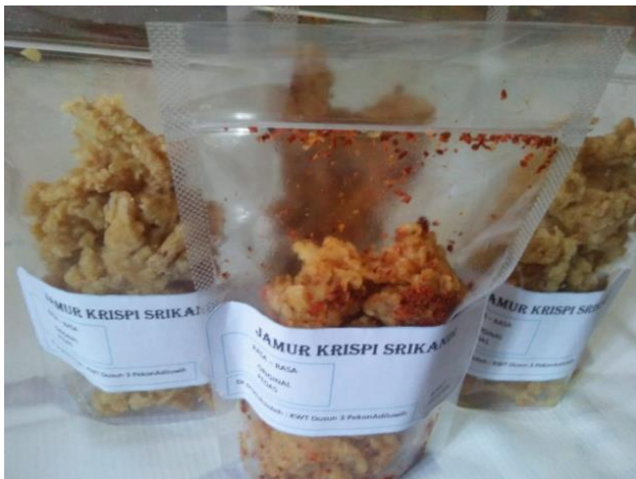
Gambar 2. Produksi jamur tiram