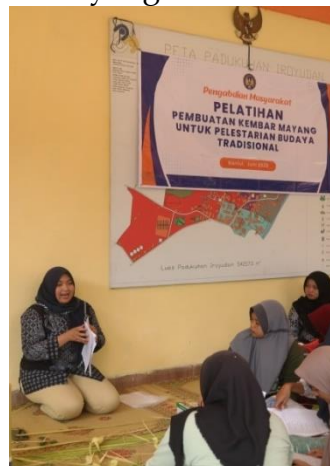
Gambar 2. Penjabaran Materi dan Diskusi Interaktif

Tahap pelatihan difokuskan pada penguatan kemampuan kognitif anggota Karang Taruna melalui pemberian pemahaman yang mendalam mengenai aspek filosofis, historis, dan teknis dari pembuatan Kembar Mayang sebagai bagian penting dalam tradisi budaya Jawa. Materi pelatihan dalam bentuk modul disampaikan secara sistematis oleh tim pengabdi yang terdiri dari dosen dan praktisi seni budaya. Pemaparan diawali dengan penjelasan mengenai alat bahan yang dibutuhkan, nilai-nilai simbolik Kembar Mayang dalam upacara adat, dilanjutkan dengan sejarah perkembangannya dari masa ke masa, serta pengenalan berbagai jenis dan fungsi Kembar Mayang dalam konteks pernikahan tradisional.