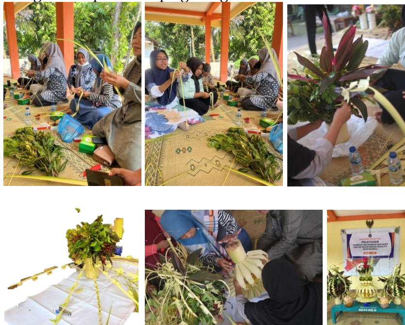
Gambar 5. Tahap Pendampingan

Setelah kegiatan pelatihan selesai, setelah kegiatan pelatihan selesai, anggota Karang Taruna diharapkan mampu secara mandiri membuat Kembar Mayang, menerapkan keterampilan yang telah diperoleh dalam berbagai acara adat, serta berkontribusi dalam pelestarian budaya di lingkungan mereka. Mula-mula pelepah pisang diisi dengan daun-daun (daun kruton, dhadhap srep, dlingo bengle, dan bunga patramenggala). Dilanjutkan dengan menancapkan janur yang sudah dibentuk keris-kerisan, pecut-pecutan, payung-payungan, manuk-manukan, dan walang-walangan mengelilingi pelepah pisang. Satukan janur dan ikat di atas daun-daun. Selanjutnya membuat clorot pada kelapa gading. Mula-mula kelapa di kupas bagian kulit atas dan dibentuk clorot dari janur dan ditancapkan tiga clorot pada kelapa gading.