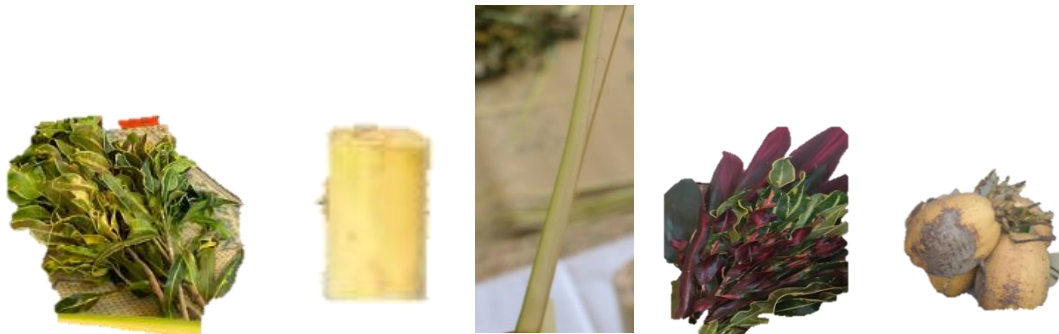
Gambar 3. Daun-daunan, Kelapa Gading, dan Janur

Pelatihan ini berfokus pada latihan dan praktik langsung dalam pembuatan Kembar Mayang, di mana anggota Karang Taruna akan dibimbing dalam setiap tahap proses, mulai dari pemilihan bahan, teknik merangkai, hingga penyelesaian akhir sesuai dengan standar tradisional.