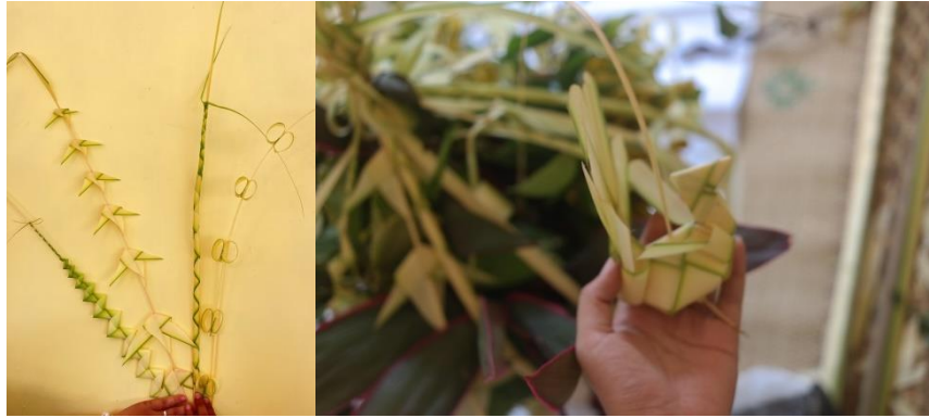
Gambar 4. Bentuk Kreasi Janur