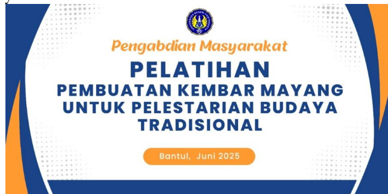
Gambar 1. Banner Pelatihan